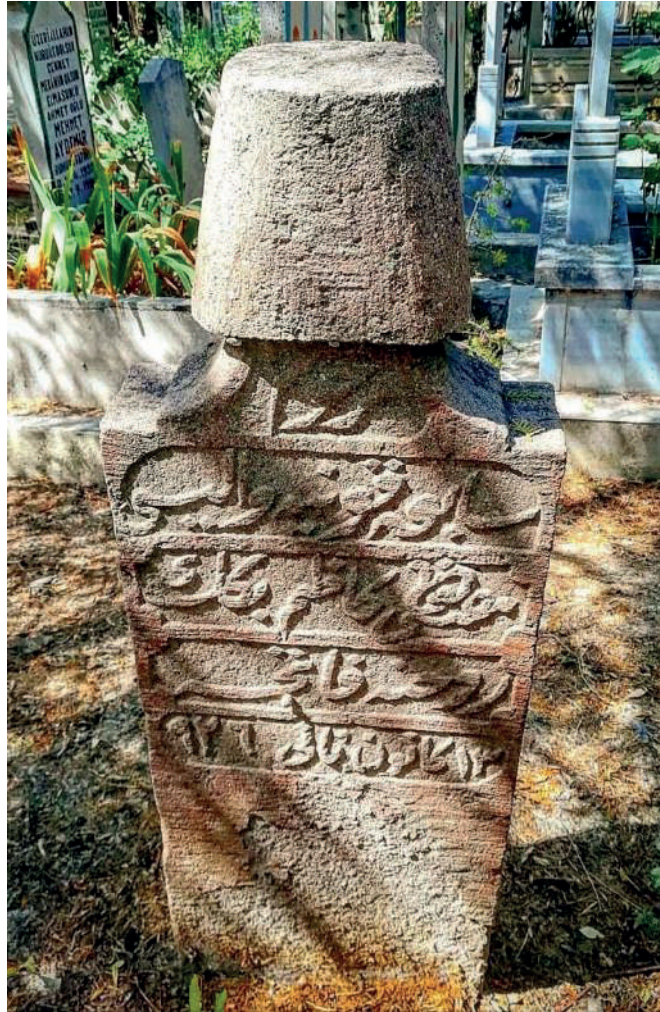
Ek 3: Mustafa Kâzım Bey'in Tekke Mezarlığı'ndaki Kabir Taşı (Fotoğraf: Hasan opur).