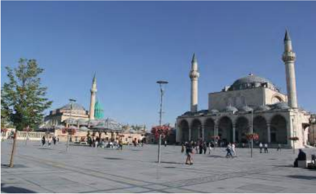
Fotoğraf 3: Konya Sultan Selim İmareti'nin yerine yapılan parkın günümüzdeki görünümü (Zekeriya Şimşir'den).