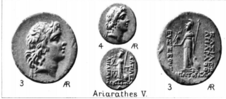
Resim 1. Kappadokia Kralı V. Ariarathes döneminde basılan sikkeler*.

küçüğü olan Ariarathes ise Roma'ya gönderilmişlerdir. Öz evlat olan Mithradates ise çocukluktan yetişkinliğe geçiş döneminde adını V. Ariarathes olarak değiştirmiştir. IV. Ariarathes ise evladının yetişmesiyle birlikte onun üzerinden baskısını çekmiştir. Böylece baba ve oğul arasında karşılıklı saygıya dayanan bir ilişki kurulmuştur. IV. Ariarathes aralarındaki iyi ilişkilerin etkisiyle oğlu V. Ariarathes'e (Resim 1) kendi isteği ile tahttan çekilme kararını iletmiştir. Ancak V. Ariarathes anne ve babası hayatta iken böyle bir isteği kabul edemeyeceğini krala ifade etmiştir. Böylece V. Ariarathes, babasının vefatından sonra Kappadokia tahtına kral olarak çıkmıştır (MÖ 163) 19 .